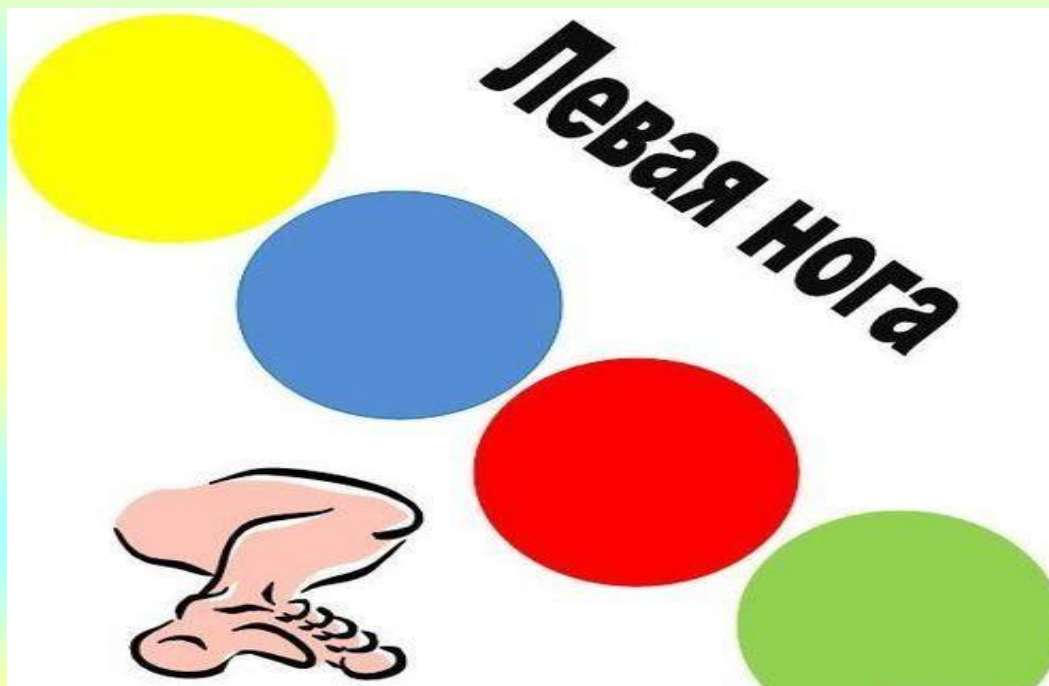
Рис.7 Изготовление циферблата для твистера. Левая нога.