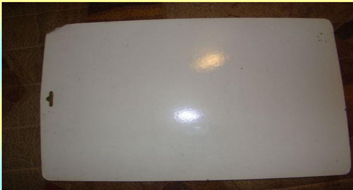
Рис.10 Изготовление циферблата для твистера. Картонная основа циферблата.

Берем картонную основу для циферблата твистера.