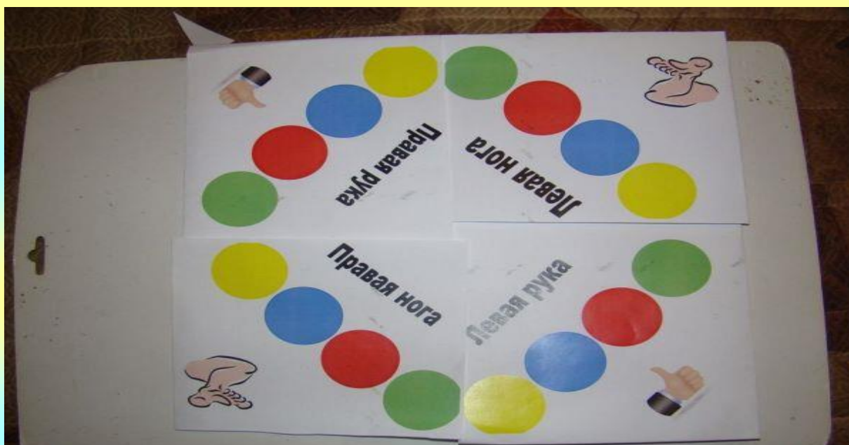
00Рис. 13 Стрелка для циферблата твистера.