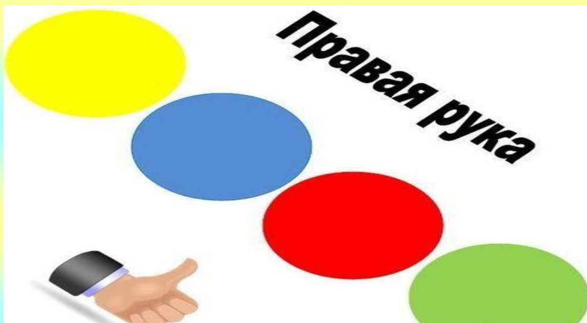
Рис.8 Изготовление циферблата для твистера. Правая рука.

Распечатываем картинки на цветном принтере, и обрезаем.