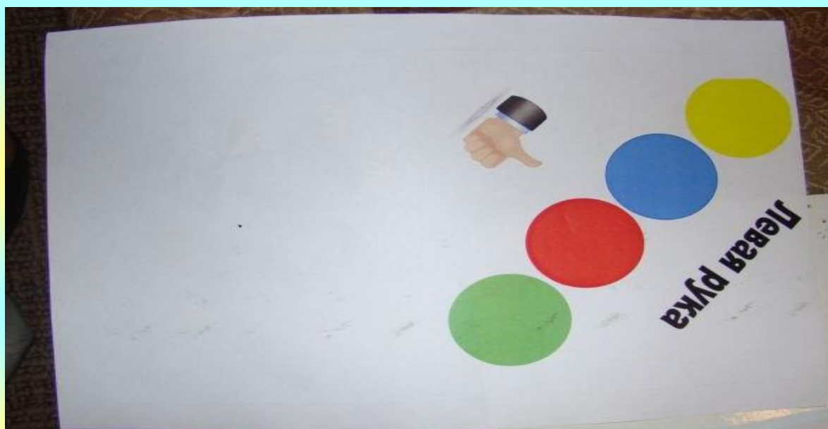
Рис.9 Изготовление циферблата для твистера. Распечатываем и обрезаем картинки циферблата.

Распечатываем картинки на цветном принтере, и обрезаем.