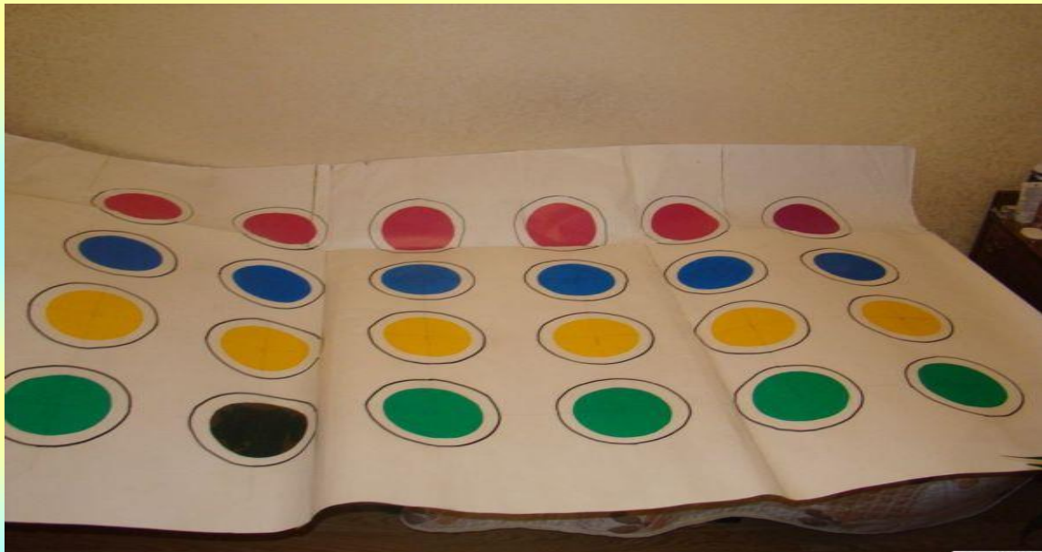
Рис. 2 Основа для игры твистер.

4) Теперь необходимо сделать циферблат, по которому ведущий будет определять действия игроков. Картонку нужно поделить на 4 части и каждую часть тоже на 4. Из обрезков нужно вырезать и наклеить, чередуя, на картонку цветные треугольники (или покрасить красками). На 4 частях картонки нужно написать: правая рука, правая нога, левая рука, левая нога.