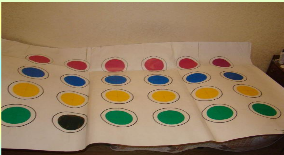
Рис. 1 Основа для игры твистер.