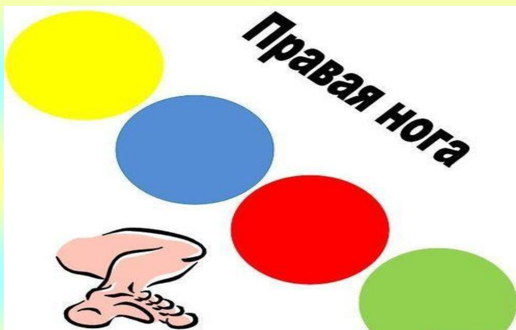
Рис.6 Изготовление циферблата для твистера. Правая нога.