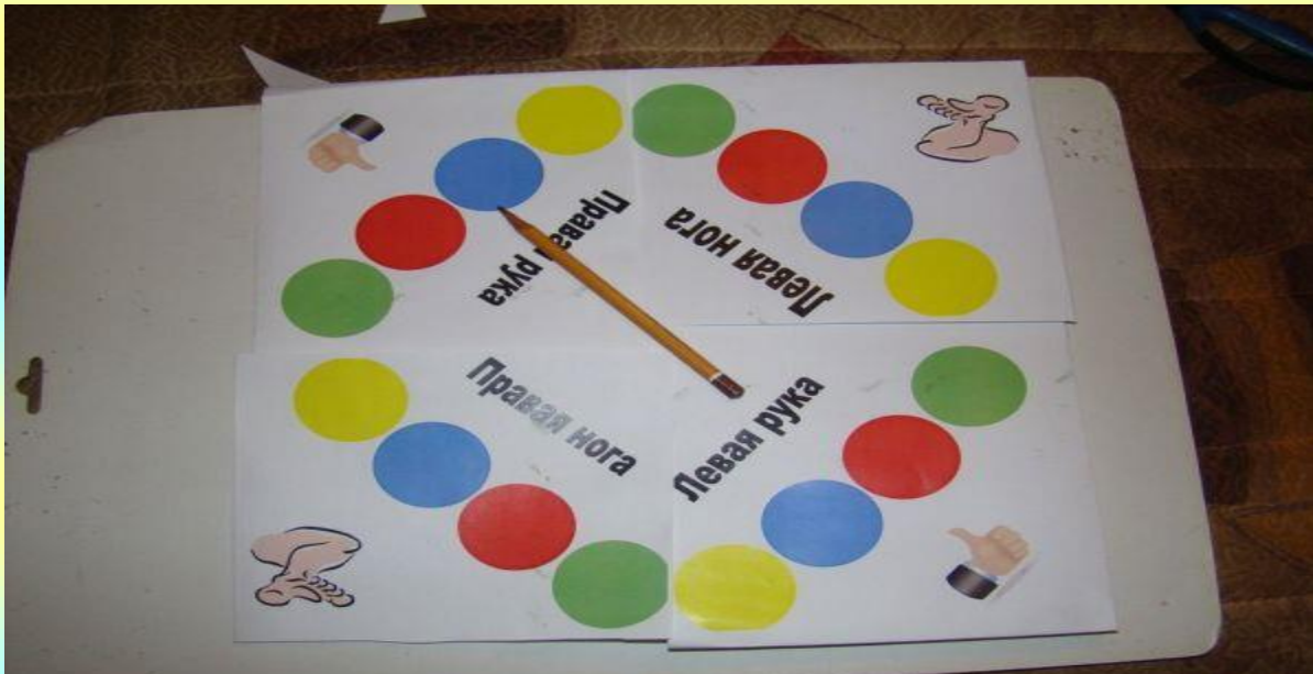
Рис.12 Циферблат для твистера почти готов.

Получаем, вот такой вот квадрат, который можно обрезать ровно по картинкам, а можно оставить как есть